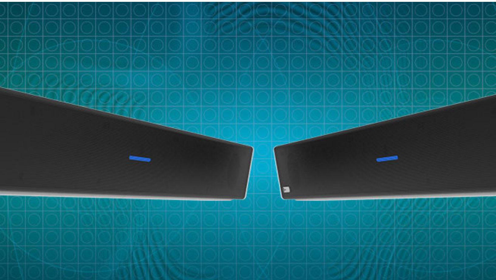
Nureva Dual HDL300